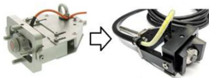
Figura 5. Atualização do handle antigo (à esquerda) para novo.