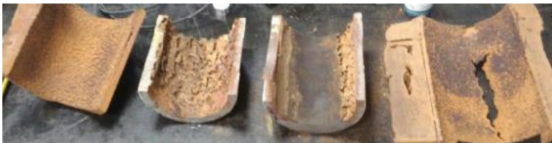
Figura 1. Amostras de tubulações rígidas corroídas internamente.

O cenário de corrosão das estruturas submarinas analisadas pode variar drasticamente, dependendo de diversos fatores como, por exemplo, temperatura, pressão e velocidade do fluido escoado, material de construção da estrutura submarina e, entre as principais, o tempo operacional. Na Figura 1 temos tubulações metálicas rígidas corroídas internamente.