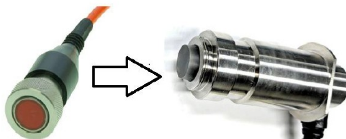
Figura 4. Atualização do transdutor antigo (à esquerda) para o novo (à direita).