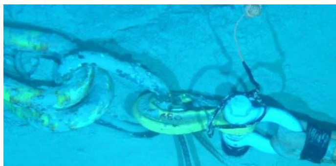
Figura 3 – Conexão entre cinta e cacho de amarras