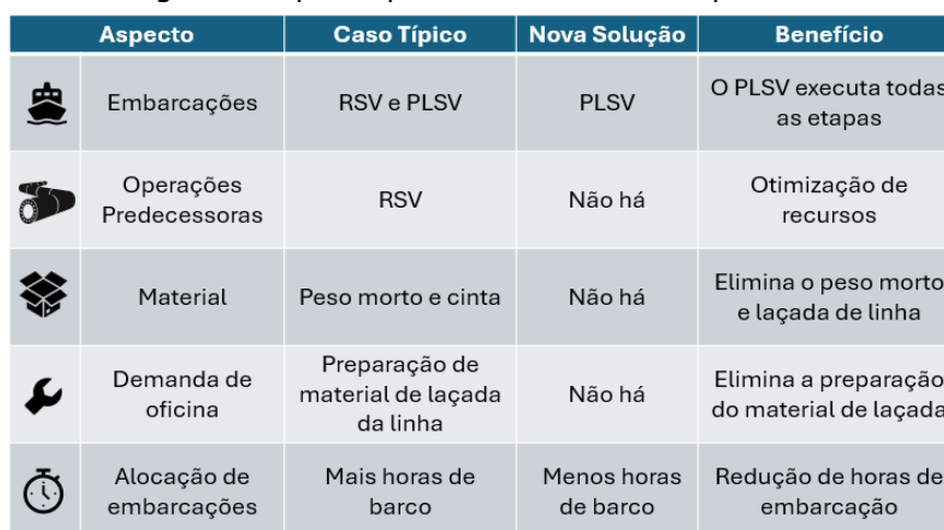
Figura 8 – Aspectos para aumento do nível de prontidão

Com base neste retrato, pode-se dizer que com a adoção da “Nova Solução” há significativa redução de escopo e recursos envolvidos, assim como aumento no nível de prontidão, o que é corroborado pela Figura 8 a seguir e será demonstrado, de forma quantitativa, na seção “Resultados” deste trabalho. Vale dizer que no passo “Recuperar extremidade-recolher-executar corte de 2ª ( pull out com corte emerso – PLSV)”, o citado corte emerso -- apesar de compor a operação contida neste passo operacional, conduzida pelo PLSV -- é executado no lado da plataforma por equipe a bordo e não pelo PLSV, que fica, nesta fase da operação, aguardando a conclusão do corte em posição segura para então concluir o recolhimento do trecho riser e o referido passo operacional. Vale ainda dizer que o corte pode ser tanto emerso quanto submerso, sem prejuízo do uso da ferramenta na solução aqui apresentada.