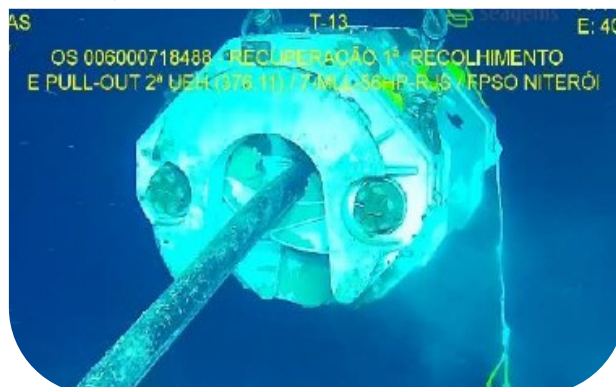
Figura 6 – Ferramenta travada ao tramo