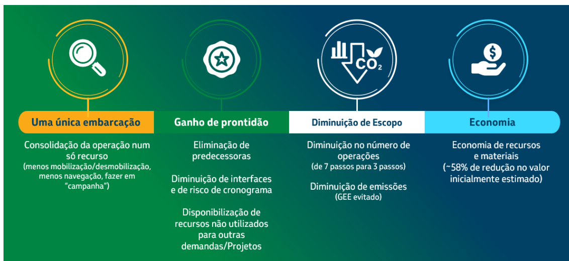
Figura 10 – Pontos-chaves de ganhos com a nova solução