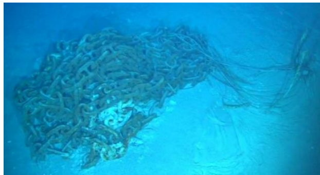
Figura 1 – Abandono de cacho de amarras

Portanto, antes do início de qualquer atividade relativa ao pull out de segunda extremidade, por vezes realiza-se a ancoragem provisória da linha flexível, tratando-se, conseqüentemente, de uma atividade do tipo predecessora. De acordo com Petrobras (2024a), e conforme exemplificado nas Figuras abaixo, para a execução dessa atividade é realizado o lançamento de um elemento de massa estabilizador, constituído por cachos de amarras, por uma embarcação do tipo Anchor Handling Tug Supply (AHTS) ou ROV Support Vessel (RSV) (Figura 1). Em outro momento, um navio RSV prepara a linha flexível, em ambiente submarino, com cintas de cargas que serão conectadas ao cacho de amarra, de acordo com a Figura 2. O cacho de amarra e as cintas possuem interfaces compatíveis que permitem a sua conexão com o auxílio do ROV, conforme ilustrado na Figura 3. Por fim, os cachos ou até mesmo as cintas podem ser ajustados para que haja o tensionamento do conjunto e a efetividade da ancoragem provisória, como representado na Figura 4. Esse é o cenário tratado no âmbito deste trabalho como “Caso Típico”, conforme será detalhado nas próximas seções.