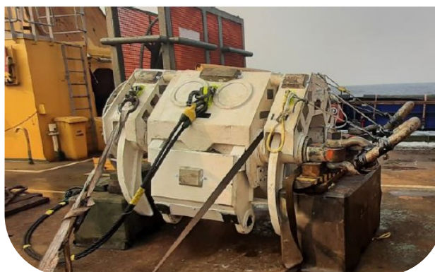
Figura 5 – Ferramenta no convés

O sistema atua abraçando a linha pela capa externa, garantindo manuseio controlado e minimizando danos à sua integridade. Suporta linhas com diâmetro externo entre Ø100 mm e Ø500 mm e possui peso aproximado de 10 t.