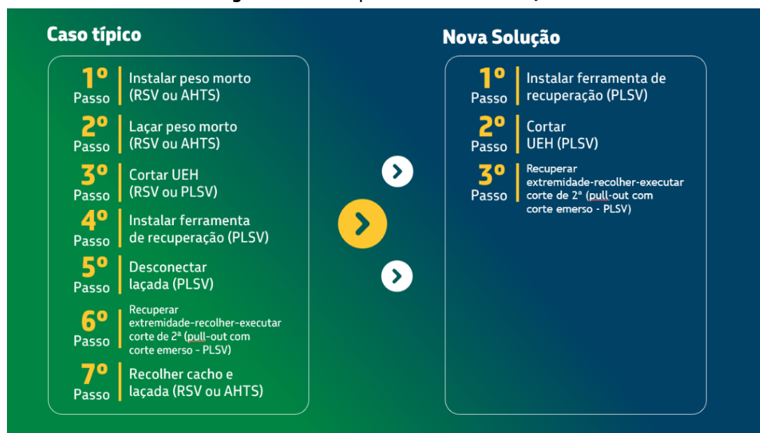
Figura 7 – Caso Típico versus Nova Solução

Nesta seção, apresenta-se um comparativo entre o “caso típico” e a “nova solução”, com a adoção da inovação tratada neste trabalho (Figura 7). Com isso, vê-se que no caso típico tem-se 7 passos operacionais, enquanto na nova solução tem-se 3 passos operacionais.