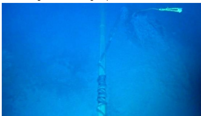
Figura 4 – Ancoragem provisória finalizada