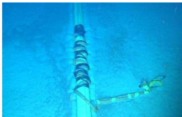
Figura 2 – Duto flexível com cinta